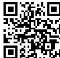
扫码观看公交车避险逃生视频。