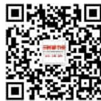
三湘都市报微信公众号“轻报纸”看E报。