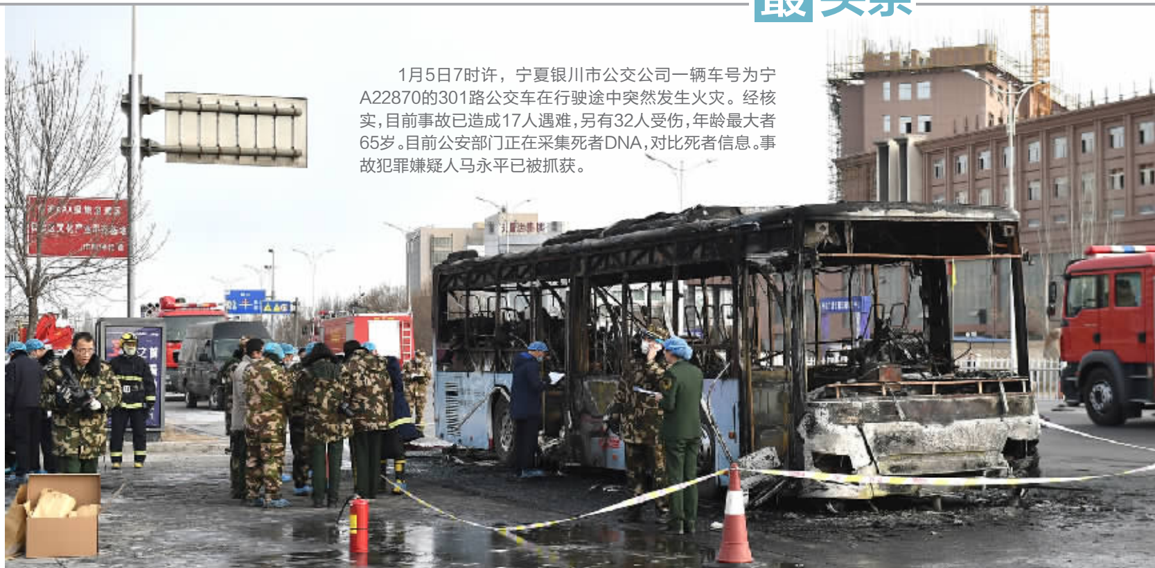
1月5日，在宁夏银川市贺兰县，公交车着火后被烧毁。

1月5日7时许，宁夏银川市公交公司一辆车号为宁A22870的301路公交车在行驶途中突然发生火灾。经核实，目前事故已造成17人遇难，另有32人受伤，年龄最大者65岁。目前公安部门正在采集死者DNA，对比死者信息。事故犯罪嫌疑人马永平已被抓获。