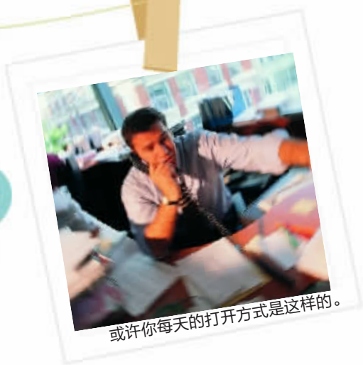
或许你每天的打开方式是这样的。