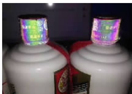
真假茅台对比图(左真右假)