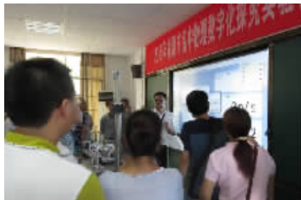
2015年9月24日，湘机中学成功承办2015年湘潭市高中物理数字化探究实验教学研修班。