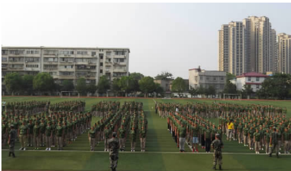
新生军训，会操表演。

2015年高考一本上线达39人；前5500名的优秀生源中，湘机中学为66人，2015年高考二本以上上线达154人；当年中考成绩760分以下的有9人上一本，32人上二本，再次谱写了“让优秀者保持优秀，低进高出”的佳话。