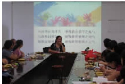
湘机中学拥有一支高素质的教师队伍。这是语文教研组在召开学习研讨会。