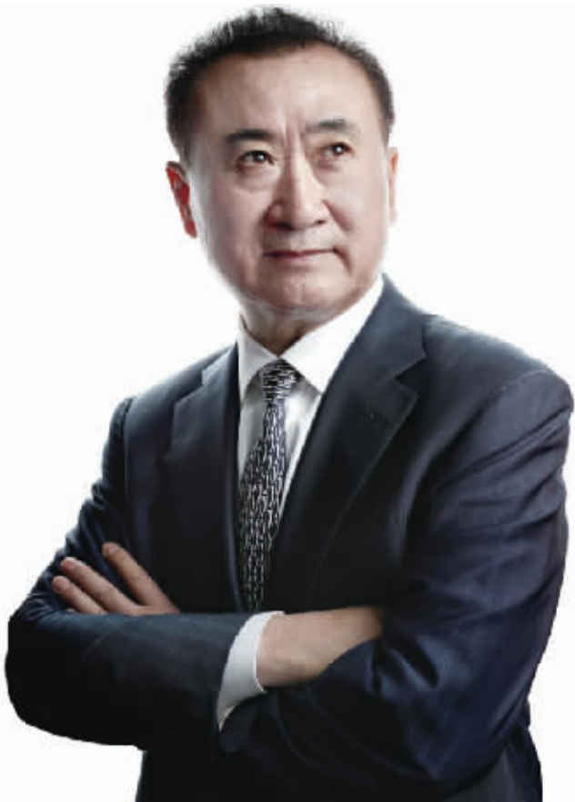
万达集团董事长王健林