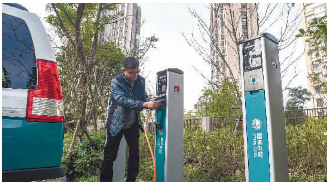
12月27日，长沙市政府大楼前杜鹃广场南面，市民正在为新能源汽车充电。