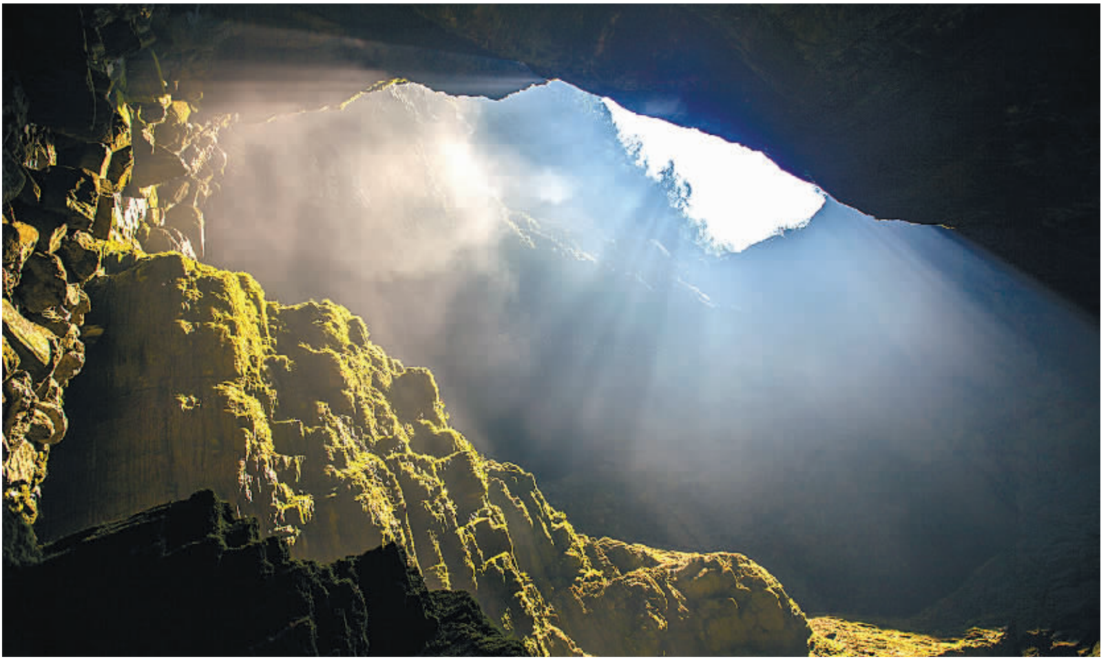
美丽雄伟的犀牛洞洞口。犀牛洞位于龙山县大安乡境内，洞口海拔1240余米，是湘西海拔最高的洞穴，以险、幽、奇著称。