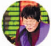
“专家说牛市刚起步!”