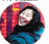
“儿子的婚房有着落了”