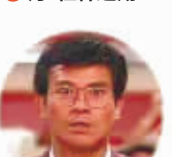
“不要怕!只是技术性调整!”