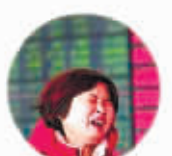
“国家队都出手了,为什么还这样!”