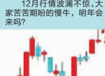
“梦想还是要有的,万一回本了呢!”