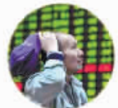
“走,还是留,这是一个问题”