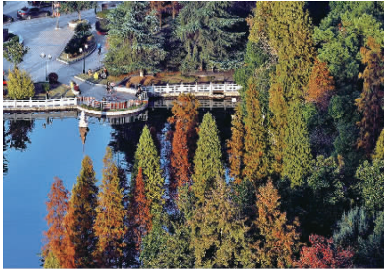
娄底绿色城区一角。