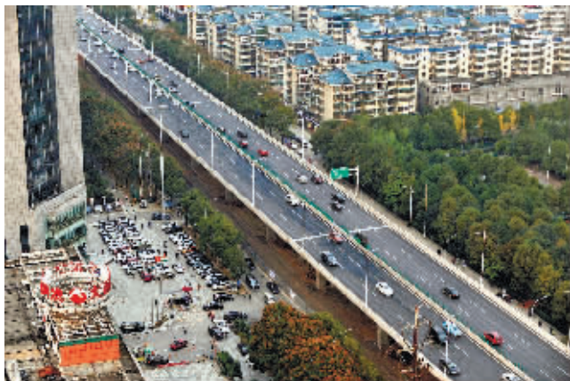
11月26日下午5点,长沙市万家丽路高架桥人民路路段,桥上车辆行驶较为通畅。

记者行驶途中,在万家丽广场附近路段处,一名市民竟骑着电动车行驶在了最右边车道上,随后车辆不时减速换挡或鸣笛示警。