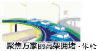
聚焦万家丽高架拥堵·体验