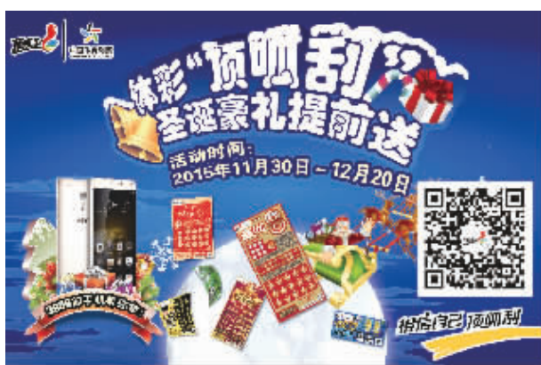
“顶呱刮”圣诞豪礼提前送

(IVT或BCR等)完成兑奖，中奖彩票进行剪角处理后，将中奖彩票返还给中奖者，通过活动页面，输入票号、保安区验证码和本人手机号码即可参与抽奖活动。