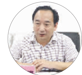
省国资委主任从培模

到2020年,要培育10家以上主营业务收入过百亿、行业领先、品牌知名、国内一流的优势企业,2-3家主营业务收入过千亿、具有国际竞争力、跨国经营的大型国有控股集团。