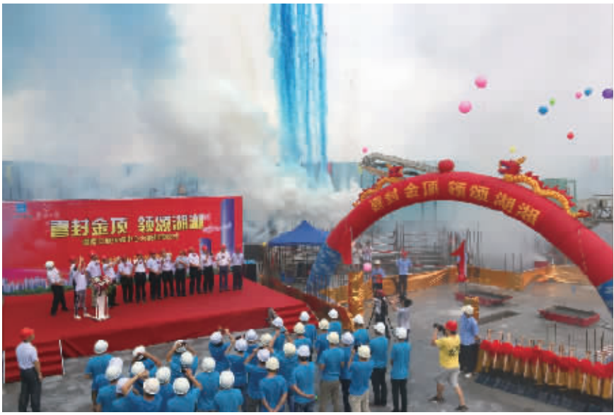
湖南日报传媒中心封顶仪式。