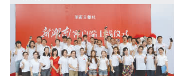
报社员工在活动现场开心留影。

习近平总书记要求“要着力打造一批形态多样、手段先进、具有竞争力的新型主流媒体,建成几家拥有强大实力和传播力、公信力、影响力的新型媒体集团”。这是我们再出发的最大原动力。