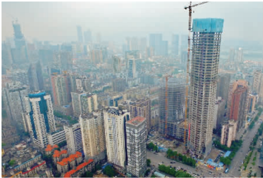
8月15日上午,湖南日报传媒中心大楼封顶。