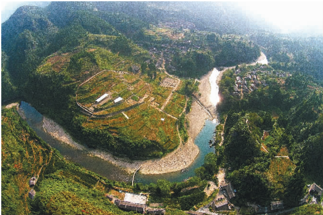
老司城遗址航拍图。

湘西自治州州委副书记李平认为:“老司城所承载的土司制度体现了东方智慧,是世界唯一的制度,为当今世界多民族国家如何和谐相处提供了借鉴,对中国而言,让中国传统的政治文明成为普世价值,提升了中华文化的软实力。”