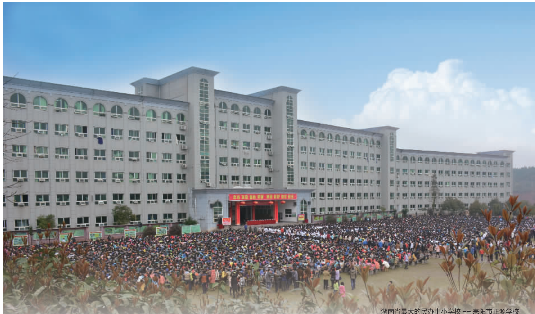
湖南省最大的民办中小学校——耒阳市正源学校