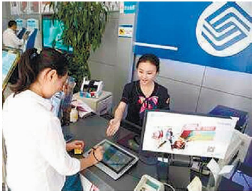
中国移动工作人员热情地为消费者办理业务。

“移动5·17,就是这么任性,只为给消费者送上实实在在的福利!”湖南移动负责人说。