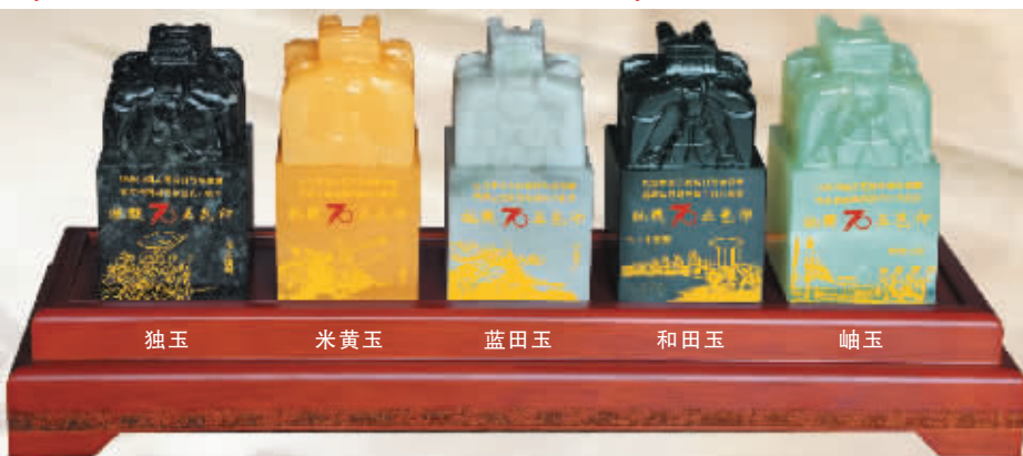
中国最早龙的形象,就是用独山玉制作;米黄玉被称为“黄金玉”,近几年升值最快;“价值连城”的“和氏璧”蓝田玉雕成;和田玉“乾隆玉玺”拍卖4.8亿新台币;数十亿的国宝“金缕玉衣”玉料就是岫玉

从1998年起,独山玉由于矿料稀缺,面临资源枯竭,已经被限制开采,权威部门为了纪念抗战胜利70周年,破例动用封存的库存玉料,“中华五大名玉·抗战五玺”以远远低于市场价格的超低价发行,机会仅此一次!