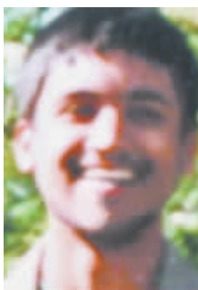
英国媒体披露的萨劳照片。

2010年5月6日，道琼斯指数在20多分钟内暴跌约1000点，其中最剧烈的600点下跌发生在5分钟内，之后指数又大幅回升。这一交易日也创下美国股市有史以来最大单日盘中跌幅，堪称华尔街历史上波动最为剧烈的20分钟。