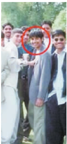
萨劳1995年的中学合影。

萨劳如今面临美方司法部门提起的一项电信欺诈、10项大宗商品欺诈、10项大宗商品市场操纵行为以及一项欺骗行为指控。如果被裁定成立，这些指控合计将为萨劳带来最高380年监禁。