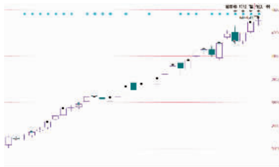
3月9日至4月23日，沪指最高涨幅近40%。

在方正证券王沛银看来，一方面目前打新采取的是市值配售的方式，投资者手中需要持有相应市值的股票才能申购新股，申购资