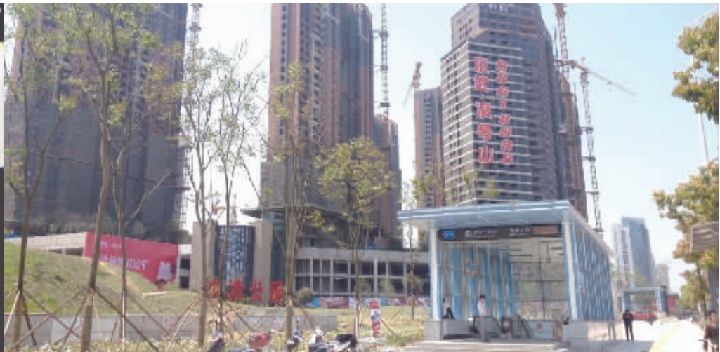
实地测量得出,从沙湾公园站2号出口至京武·浪琴山售楼部仅247步。