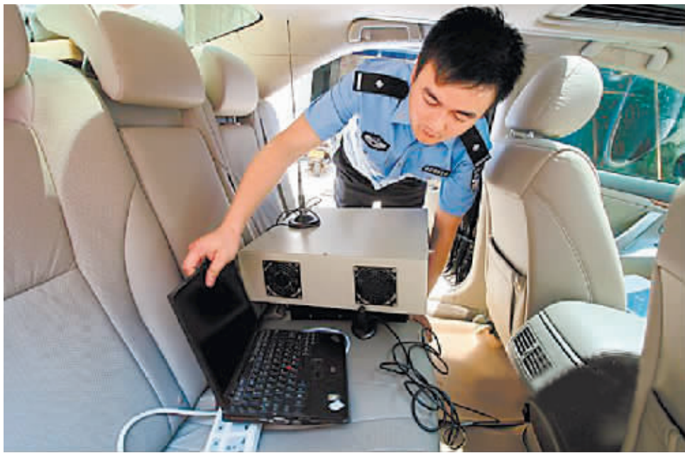
湖南移动积极配合公安机关打击“伪基站”。

湖南移动网优中心和网管中心研发了“伪基站”监测发现手段，优化全网无线参数以压制“伪基站”信号，长沙、娄底、衡阳、株洲、湘潭等分公司配合公安机关打击了十起伪基站违法犯罪行为，抓捕多人，缴获多套“伪基站”设备。