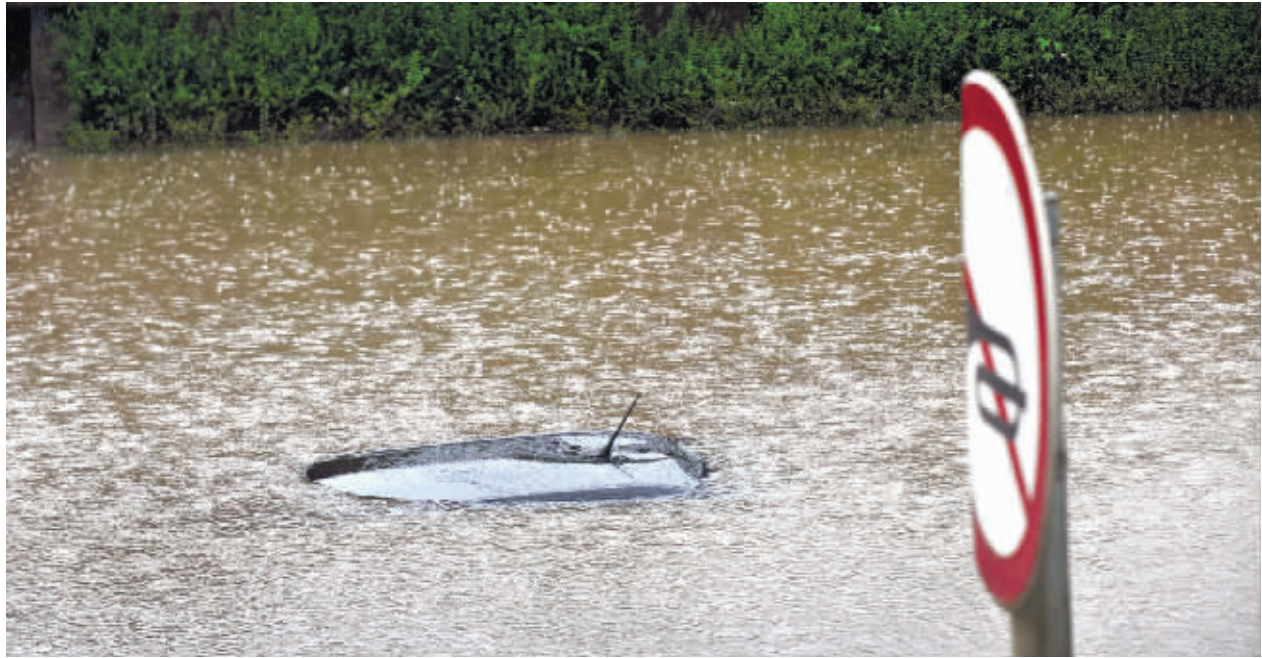
4月7日下午，长沙市亚大路，一台小车被积水淹没，只剩下车顶露出水面。记者 田超 摄