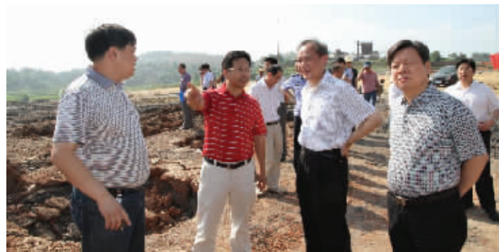
邵阳市市委书记郭光文(右二)视察东互通建设。

如果将城区比作月亮,围绕在城市周边的乡镇就是“捧月之星”。2014年,邵阳市住建局继续以推进新型城镇化为主题,以保障和改