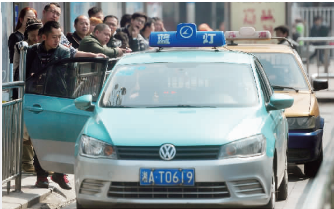
3月25日,长沙火车站,市民在搭乘出租车。当天,长沙出租车营运价格正式调整。

从13公里开始加收空驶费。 低速及等待计时费:每满2分钟计费1元。 电召费:3元/次。