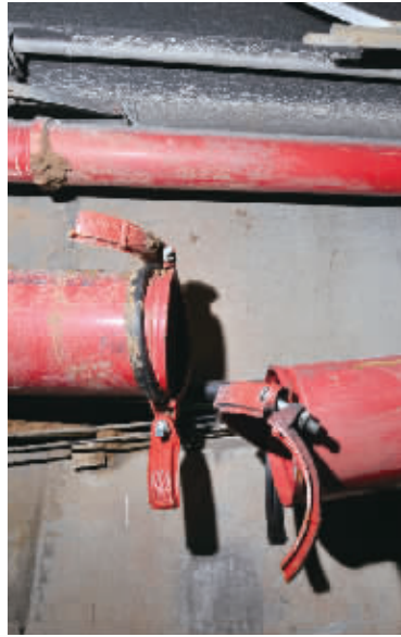
3月24日上午,长沙市南湖路湘江隧道南线西往东方向部分侧墙及附属设施受损严重(右图),工作人员正在事故现场抢修(左图)。