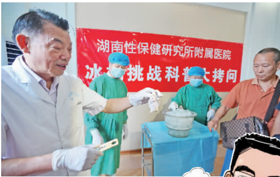
2014年9月10日，湖南性保健研究所附属医院的实验室内在进行小白鼠冰桶实验，小白鼠在-0.12度的冰水中浸泡不到5分钟后失去生命体征。

采访中，陈光标对湖南性学泰斗文德元的“冰水浸泡5分钟可致不育”一说也做出了侧面回应，“如果桶里放的都是冰水，我肯定是受不了的。”