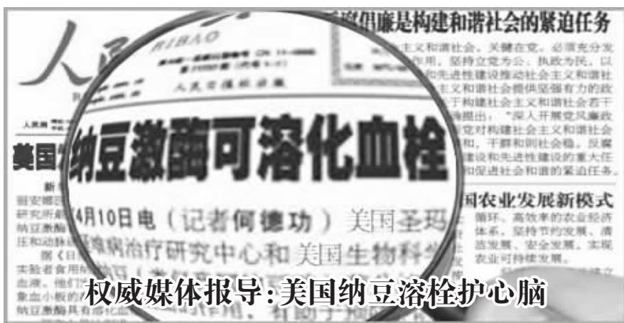
权威媒体报导：美国纳豆溶栓护心脑