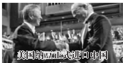
美国纳豆正式进口中国

老百姓说它是救命的产品！科学家说它是自然界中最强效的“血管清道夫”，它能让堵塞的血管畅通，让硬化的血管壁恢复弹性。分解病毒，化开血栓，启动人体强大的自我净化功能，修复神经、大脑。少吃药，恢复健康生活！