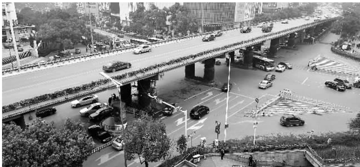
1月11日,长沙市东塘立交桥,该桥整个桥体表面几乎被绿色植物包围。

今年,立体绿化除了桥体外,还将走进公共建筑。长沙市园林管理局相关负责人表示,“今年我们将在一些学校、医院、机关单位等公共建筑实施6万至10万平方米的屋顶绿化,作为前期试点。”今年长沙将加快推进城市立体绿化,充分利用建筑屋顶、墙体、立交桥、人行天桥、护坡等一切可绿化空间,推动立体绿化建设20万平方米。