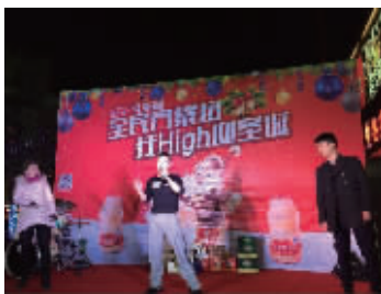
12月25日，娃哈哈乳酸菌“全民齐暴扭 狂High迎圣诞”主题活动现场。