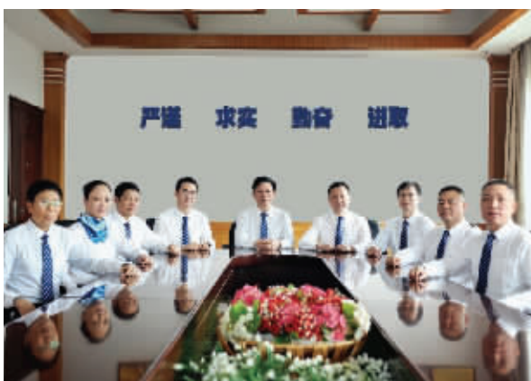
开拓进取的医院领导班子

三十年风雨沧桑,三十年奋发进取,邵阳医专附属医院赢得了社会各界的积极评价。先后获得“全国百佳人民满意示范医院”、“湖南省医疗执业、护士执业先进单位”、“湖南省消费者信得过单位”等多项荣誉。