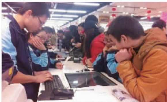
去年“双12”期间,苏宁门店人气火爆。