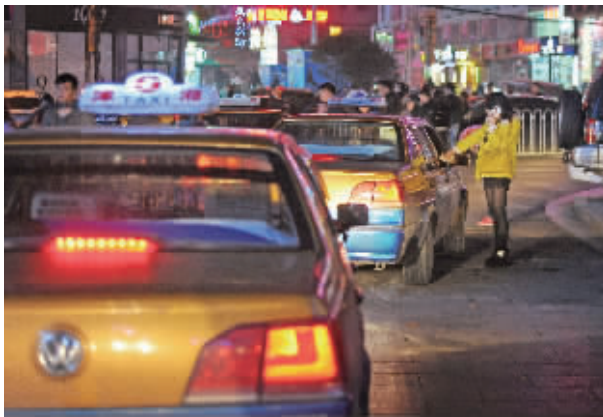
11月26日凌晨,长沙市解放西路,许多的哥还在等客。

“承包制司机会好点,主要是我们员工制司机有任务。”这名司机坦言,不少的哥对调价后的“收入”并不看好。