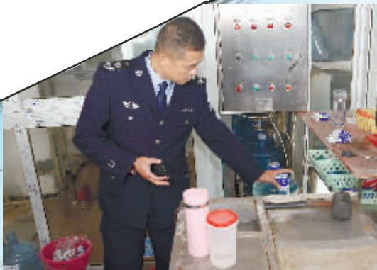
11月19日，药监执法人员突击检查桶装水生产企业。