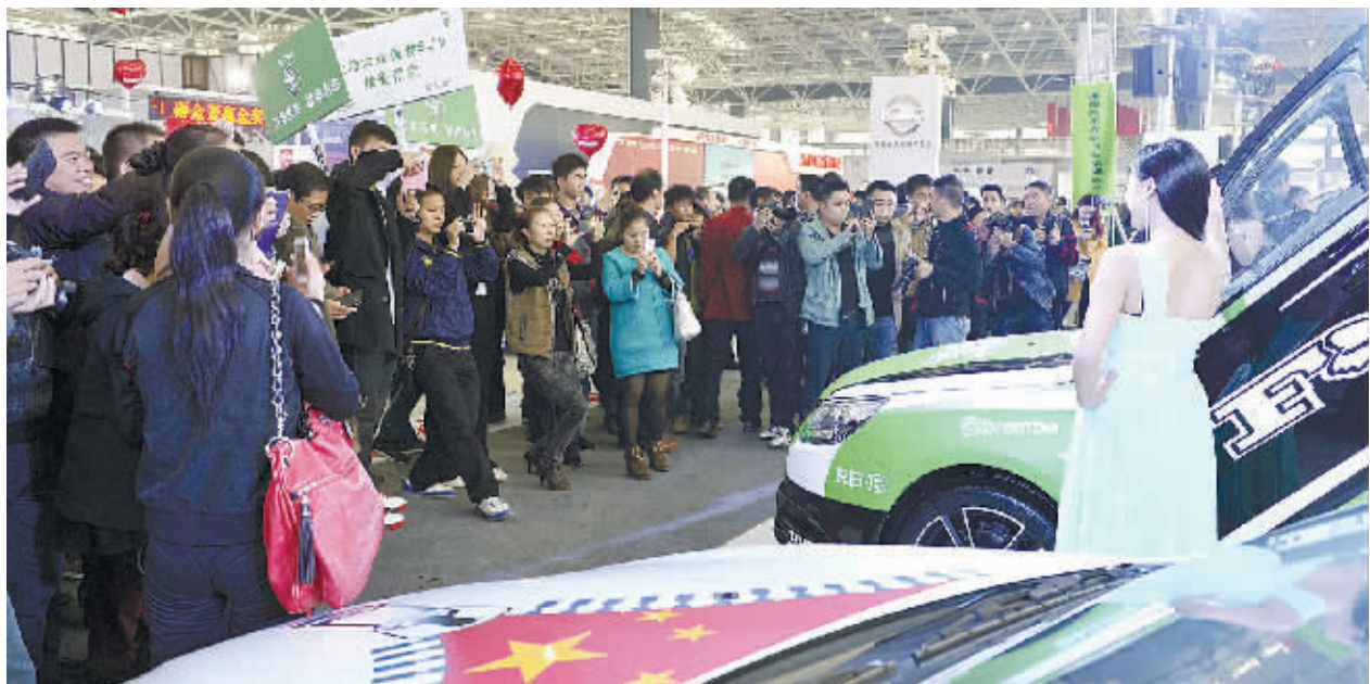
第一届湖南(怀化)国际汽车博览会现场人气爆棚。

常顺利,甚至吸引了劳斯莱斯和玛莎拉蒂这样的顶级豪华品牌从长沙远道而来参展。”车展组委会相关负责人如是说。