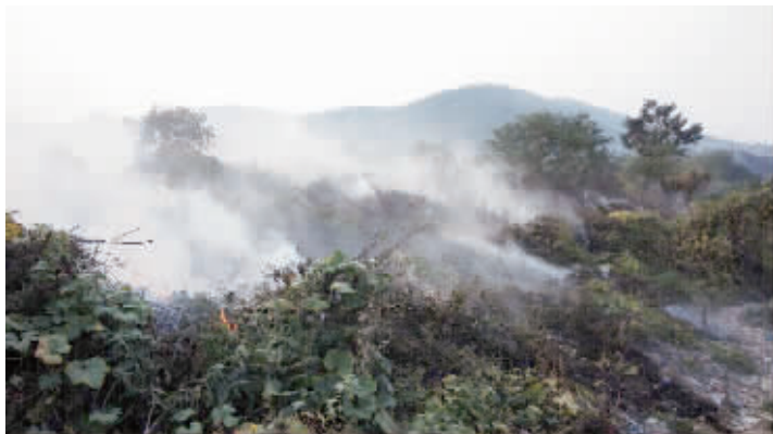
10月27日,长沙阳光100小区业主拍下的垃圾焚烧的现场图。