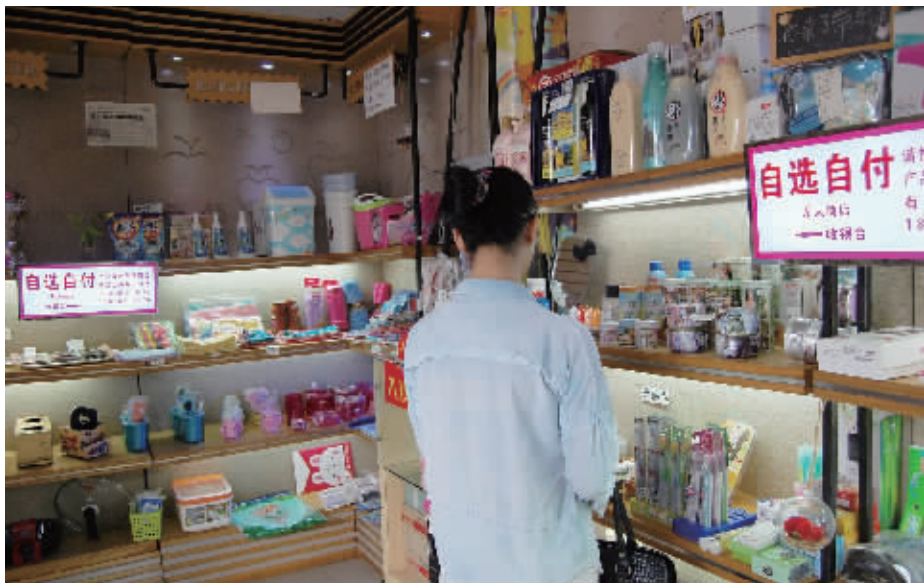
10月27日,长沙市天心区国检园小区内的“无人商店”,一名顾客正在自选商品。