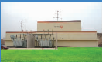
安赛乐米塔汽车板220千伏变电站。

公司将秉承“依托电力、服务电力、诚信守约、规范管理、合法经营、顾客满意”的经营理念,发扬务实高效、团结奋进的工作作风,积极开拓市场,规范内部管理,树立“联能电力”品牌意识和良好形象,实现企业稳定、健康和快速的发展,为助推湖南经济社会发展、建设坚强电网、服务广大电力客户做出新的贡献。