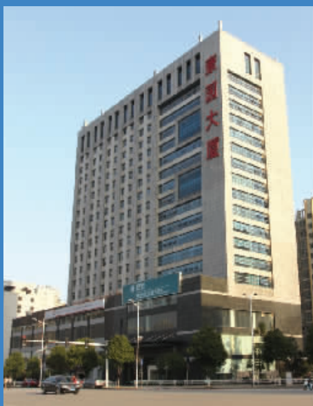
公司总部所在地——康园大厦。