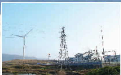
湘电新能源鲁荷金风电场110千伏项目。