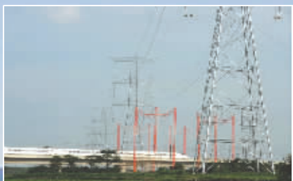
岳阳金凤桥电力线路迁改工程——跨武广高铁杆迁。