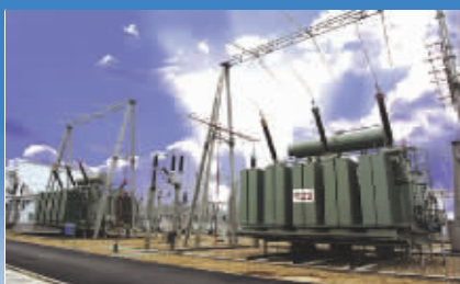
广西嘉会220千伏变电站。