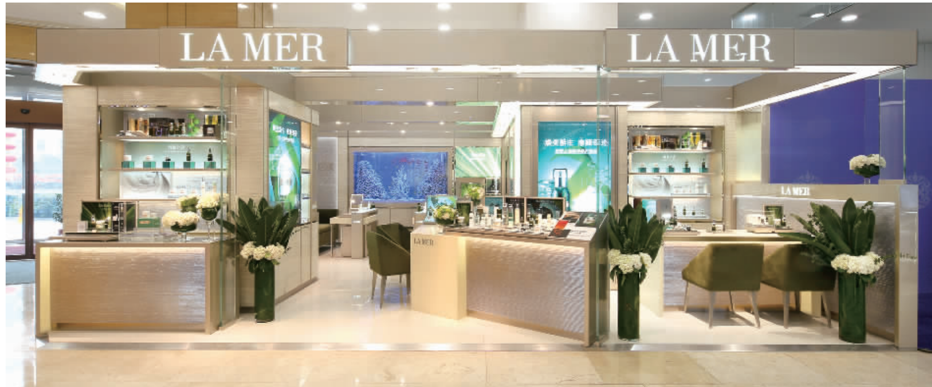
源自深海的 LA MER 海蓝之谜隆重进驻长沙袁家岭友谊商店 B 座 1 楼