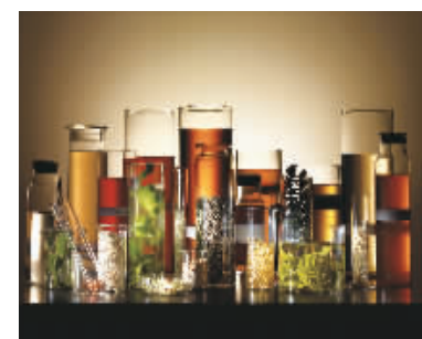
▲神奇活性精萃 Miracle Broth™。