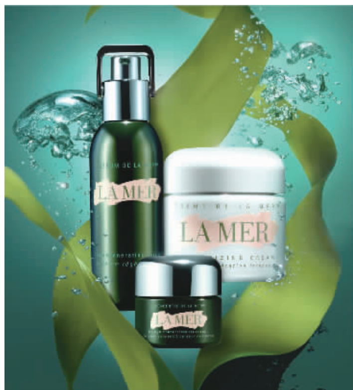
▲海蓝之谜风靡全球的经典修护臻品：(从左至右) 活颜焕肤精华露、浓缩修护眼部精华露、精华面霜。