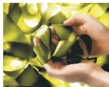
▲全手工采摘深海巨藻，以完美封存成分的完整性与鲜活性。

大程度迸发深海能量和所有成分的活性，萃炼出品牌灵魂成分、修护再生秘方——神奇活性精萃 Miracle Broth™，并以此为核心酿制出令全世界追随者无尽倾心、秘传追随的海蓝之谜精华面霜，带给肌肤五重新生——保湿滋润、修护再生、镇静舒缓、柔嫩平滑、光泽透亮，帮助肌肤重回健康平衡状态。肌肤日臻焕变，如获新生。这一瓶“小小的奇迹”，被不少爱用者誉为“一件精雕细琢的高级珠宝”，正因这如此精密繁复的酿制工艺，令其产量极为有限，在世界各地都限量供应，而备受好莱坞明星及全球名媛的追捧，成为一生中必须拥有的奢华护肤臻品。