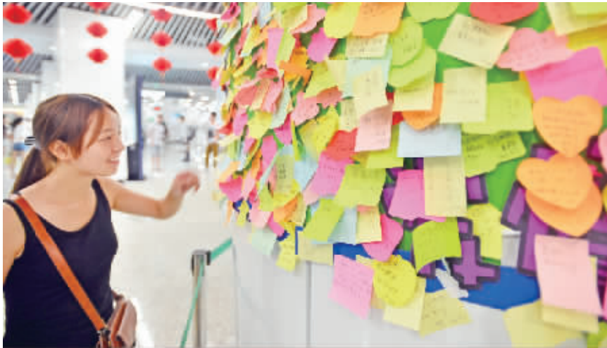
9月12日,长沙地铁2号线五一广场站的柱子上贴有不少便签条,其中有一张是市民为女儿征婚贴出的便条。