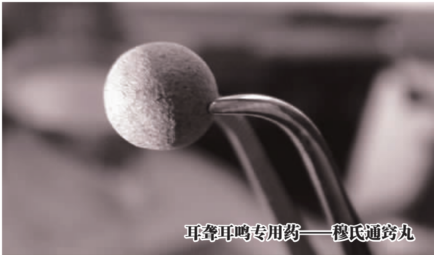
耳聋耳鸣专用药——穆氏通窍丸

据全国多家大型三甲医院的临床报告显示,穆氏通窍丸对感音神经性、药毒性耳聋,及老年性、混合性耳聋耳鸣等症有特效,有很好的效果。