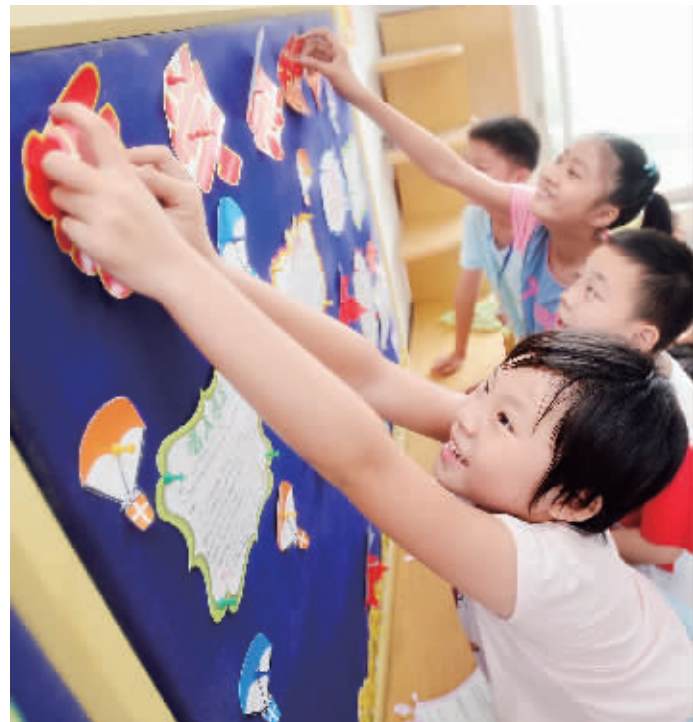
8月29日,长沙市开福区三角塘小学,同学们在制作新学期黑板报。当天,长沙市各中小学开学报到。