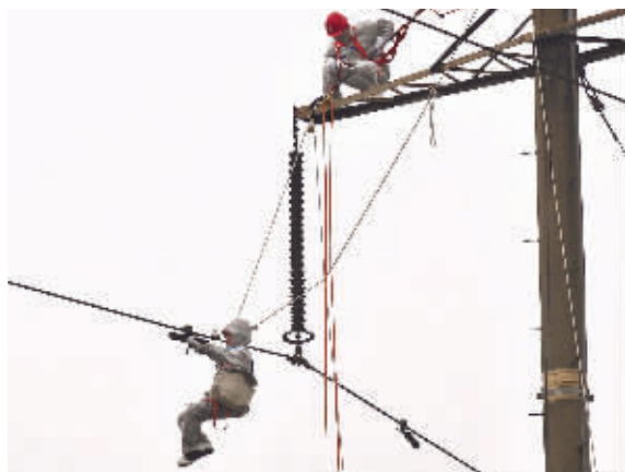
近日,长沙市望城区大湖乡西塘村,国网湖南带电作业中心工作人员在拆除导线锈蚀防震锤。

2013年,他们在全省完成输网带电作业7152次,同比增长60%,配网不停电作业8143次,同比增长61.5%,带电作业化率75.5%,同比增长18.5%。特别是今年配网不停电作业分解目标任务10000次以来,上半年已完成5183次,同比增长30%。