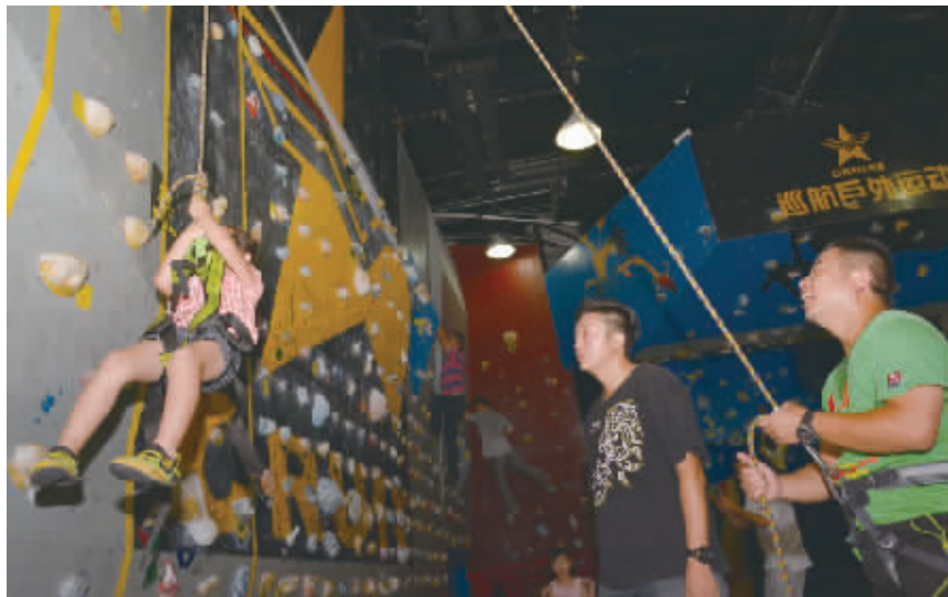
三湘好玩俱乐部组织读者体验惊险刺激的室内攀岩。