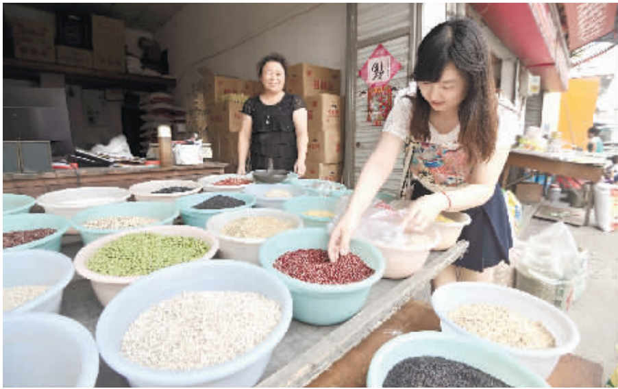
7月24日,长沙市竹山园粮油市场,一名顾客在选购豆类防暑食品。