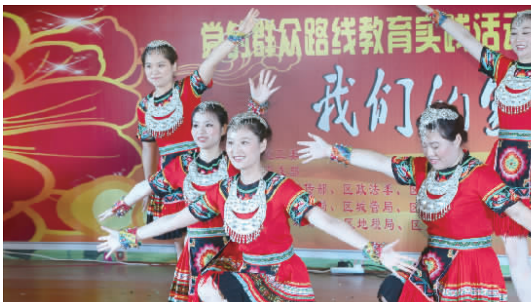
6月28日,长沙市芙蓉区荷花园街道恒达社区举行第十届群众文化艺术节。本届群众文化艺术节以“文化惠民,低碳环保”为主题,打造文化品牌,提升文化品位,让群众受到文艺熏陶。