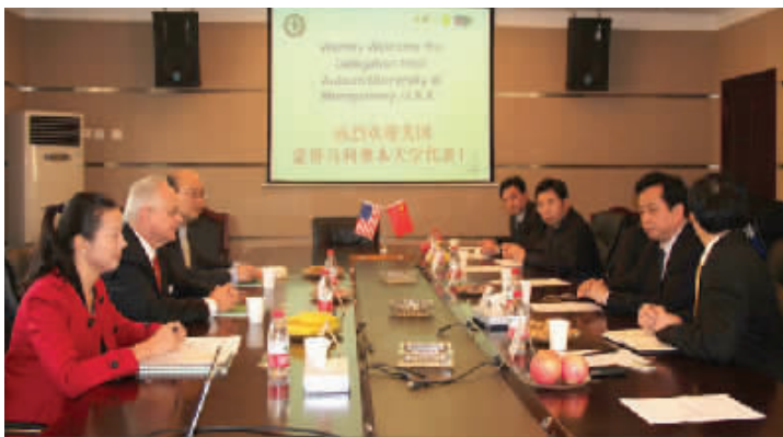
2013年美国蒙哥马利奥本大学校长访问该校