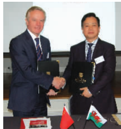
中南林业科技大学校长周先雁教授与班戈大学校长约翰·修斯教授互换执行协议

中南林业科技大学班戈学院的专业课教师，1/3来自英国班戈大学，2/3从全球选聘且须获得英国班戈大学认证。第一学年基础课阶段，学生将接受大量严格而正规的英语培训，大一期末，英语水平达到雅思5.5分以上的学生，大二时将在英国班戈大学注册学籍（英国的本科学历教育学制为三年），从而成为两校的正式在册学生，享受班戈大学学生的同等待遇。