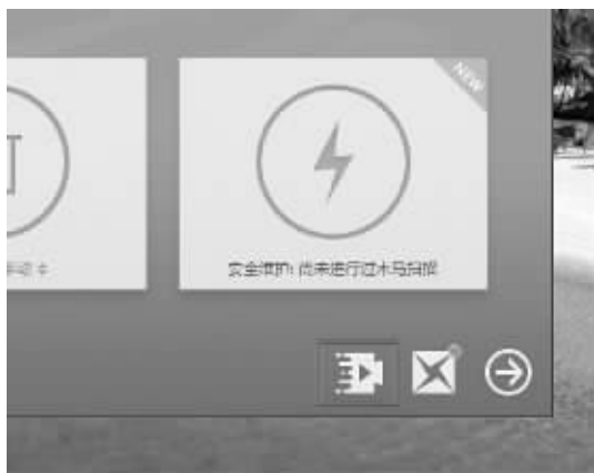
百度卫士视频加速快捷按钮位于主界面右下方

速多少。比如在线看高清视频的时候,百度卫士就可以给到最大带宽,如果只是浏览网页,那么就可以回到原有带宽速率。这样的好处是让用户按需使用自己的高带宽应用买单,按需使用的同时,还可以节省网费。拿4M带宽每月免费提速到8M计算,一年就可以让用户节省460元,按照现在覆盖2000万用户计算,40天就可以为2000万用户节省10亿元左右的上网费用,同时也解决了宽带运营商将宽带资