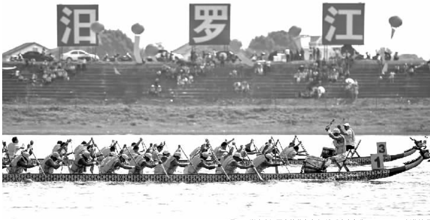
6月2日，湖南省汨罗市的龙舟赛上，选手奋力争先。