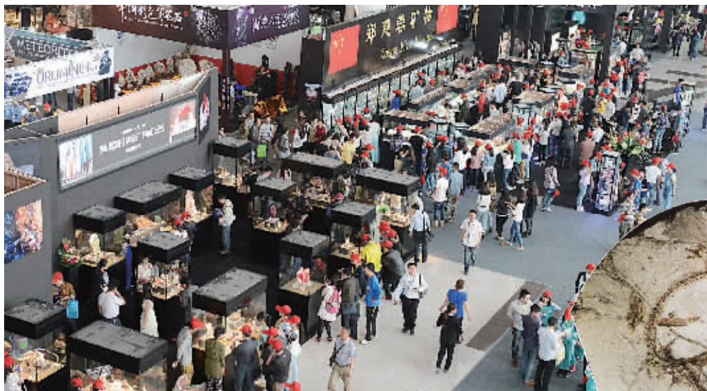
5月15日,湖南国际会展中心,市民在第二届中国(长沙)国际矿物宝石博览会现场参观。