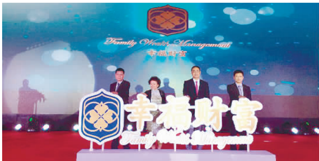
中信银行“幸福财富”品牌发布会现场。

5月15日,中信银行“幸福财富”品牌发布会暨中信银行——中信湘雅高端医疗服务签约仪式在长沙举行,标志着中信银行力推零售转型之后,服务模式和产品体验在湖南地区的全面落地。