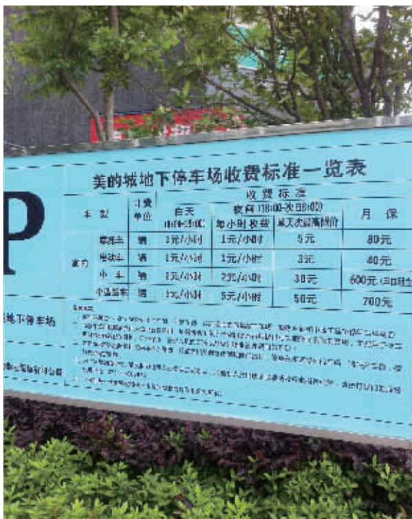
美的城物业在小区入口处竖起了这块停车收费牌。因收费过高,遭到了业主们的集体抵制。

让业主们颇感头疼的是,小区内无露天停车区域,小车必须停入地下停车场。“可收费这么贵,很少有人停进去。大部分人晚上只能把车停在小区外边的马路边,很不安全。”业主何先生说,这个收费标准比